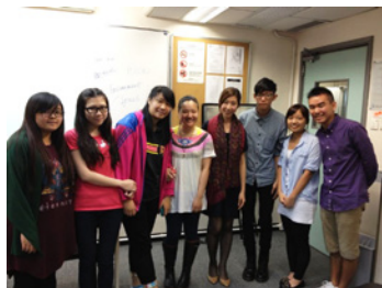
國際學院學習的生活照

每當有機會做實習，她都會十分認真，把握機會。從實習中她更適應和了解記者這份工作，認識到各報、各台的立場，真實學習和應用到採訪技巧，而且人脈網絡亦擴大了，最重要是資訊由自己找來和有機會出外見識，這是做主播、編輯、電台節目主持人等不可得到的。她認為人不僅為生存而生活，還要為追求生存意義而生活，而意義在於挑戰自己極限。正所謂：『關關難，就關關過』，她相信只要努力做，編排好事情的重要次序，就可以做到自己所追求。