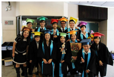
參加國際學院畢業典禮