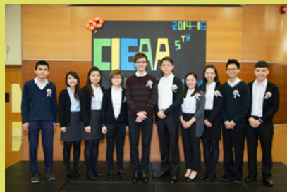
參加浸會大學國際學院校友會幹事就職禮