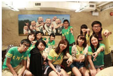
浸會大學的生活照